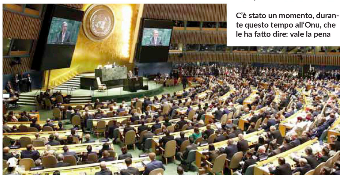
New York. Assemblea dell'ONU

La pandemia ha fatto toccare con mano e contemporaneamente in tutto il mondo, sia quello cosiddetto avanzato che quello in via di sviluppo, che problemi globali possono avere solo soluzioni globali e che se non si lavora insieme, spesso si fatica invano. In questo senso una Organizzazione intergovernativa riesce ad essere efficace nella misura in cui i membri (cioè gli Stati) sono disposti in modo condiviso a impegnarsi per dei fini comuni. Se manca tale volontà multilaterale, ben poco si riesce a raggiungere a livello internazionale. In questo senso l'Enciclica "Fratelli Tutti" aiuta a camminare nella giusta direzione creando le condizioni di fondo che rendono possibile tale spirito di collaborazione.